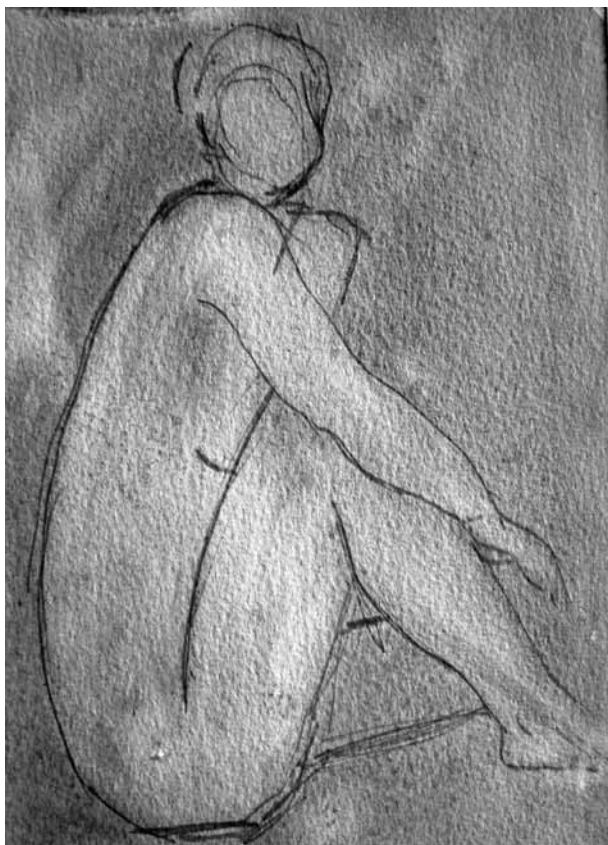
Sin título , dibujo serie Figura humana (pequeño formato), 2011 MARTHA BOHÓRQUEZ

El edificio de la ciencia se alza sobre las arenas movedizas de ese origen. Es aquí donde cabe preguntarse por el estatuto epistemológico de “la verdad”, dónde ubicarla.