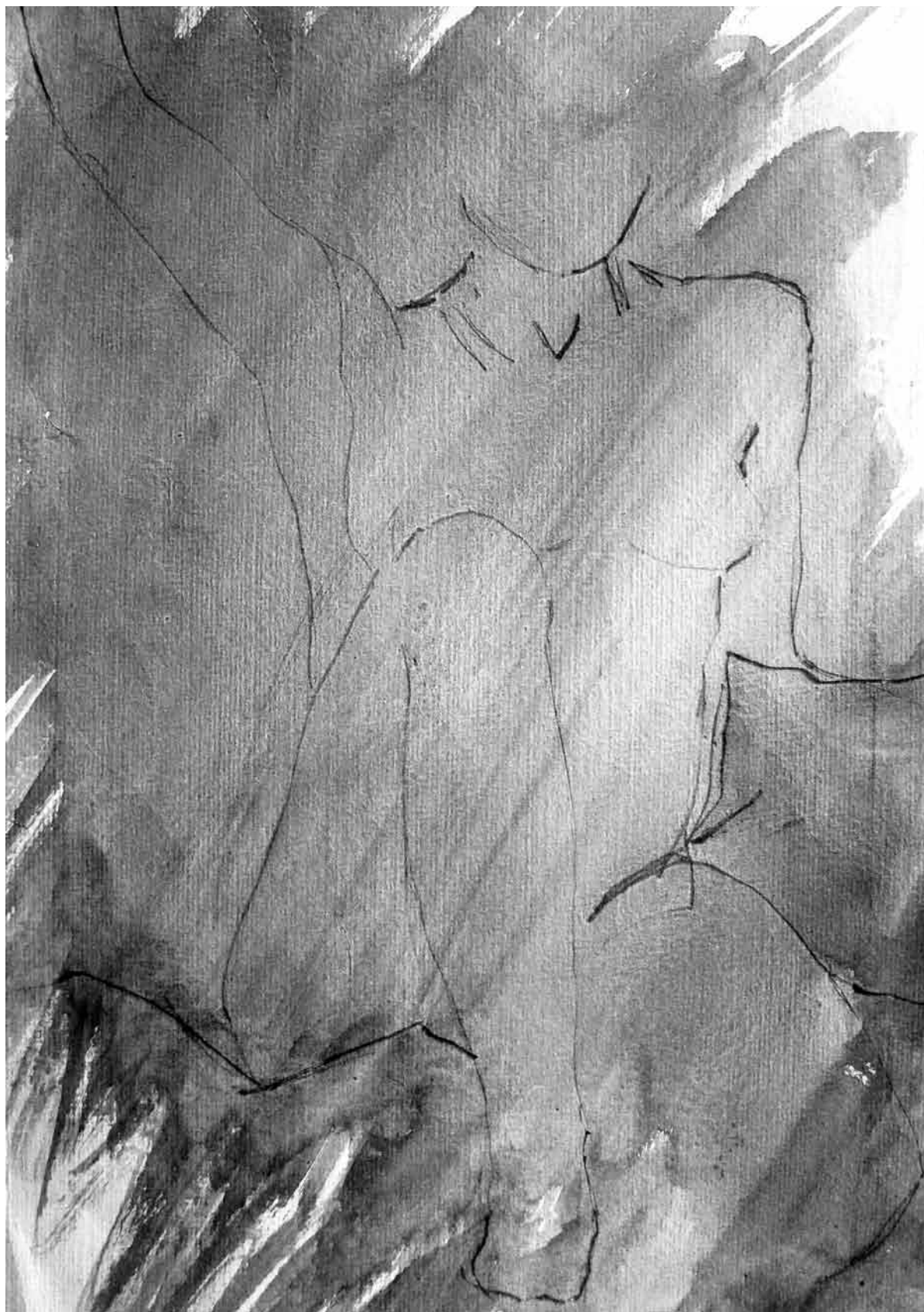
Sin título , dibujo serie Figura humana (pequeño formato), 2011 | MARTHA BOHÓRQUEZ